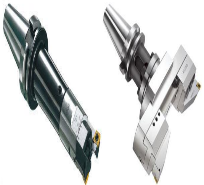
特訂製專利研發雙刀型微調整刀具